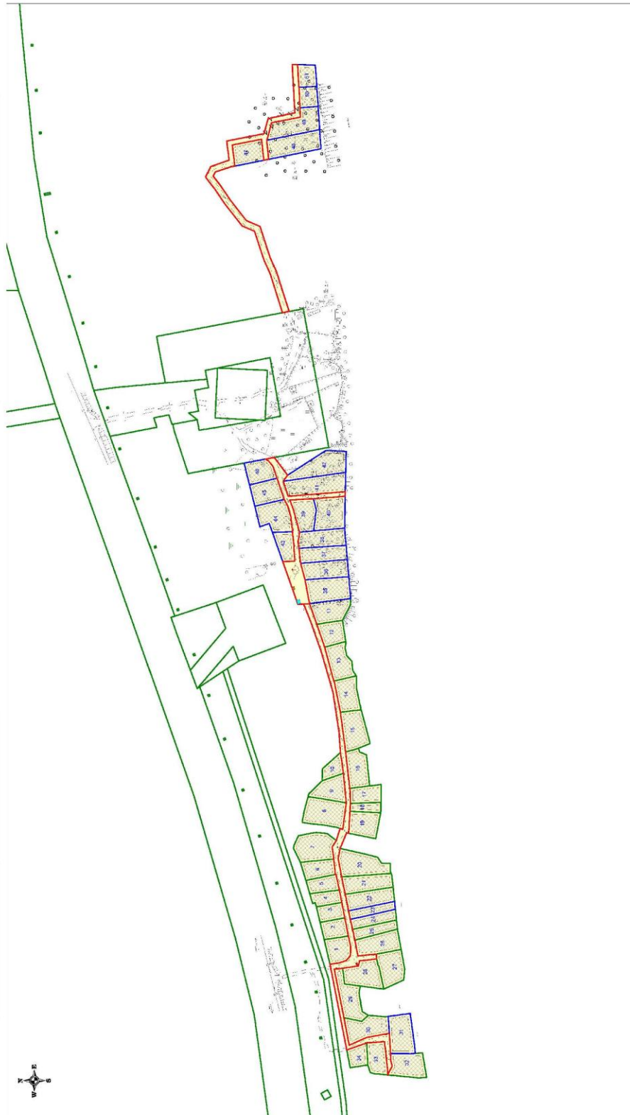
Проект планировки территории и проект межевания территории СНТ "Иргали"